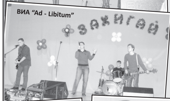
ВИА "Ad - Libitum"