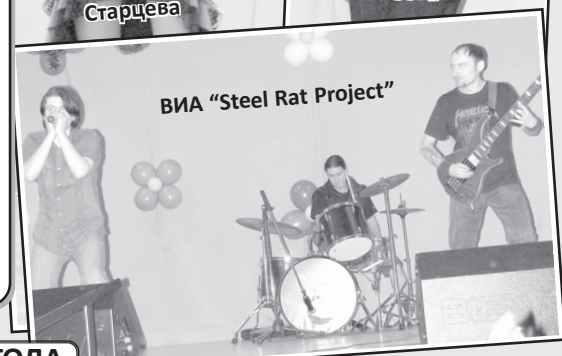
ВИА "Steel Rat Project"